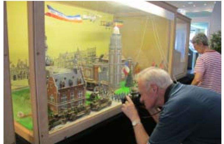
Outre les histoires, le public pouvait profiter de l'exposition à la Maison du patrimoine.

Ce dimanche : City Tour à la découverte du patrimoine militaire et de mémoire allemand de la Grande Guerre. Rendez-vous à 14 h, au château Dalle-Dumont, à Wervicq-Sud.